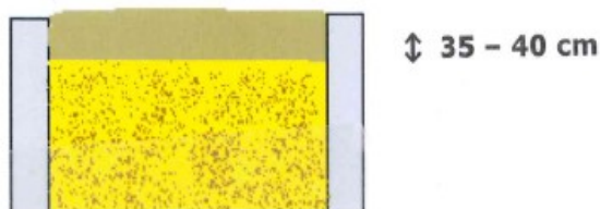
Fig. 1 doorsnede kuil sleufsilo